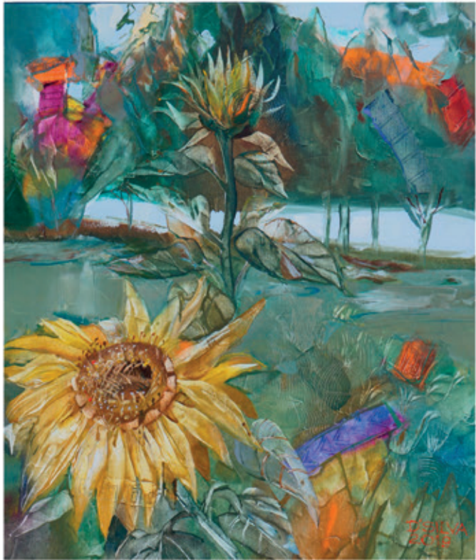
Drebeckajta Sylwia „Babie lato” 70x60 olej na płótnie