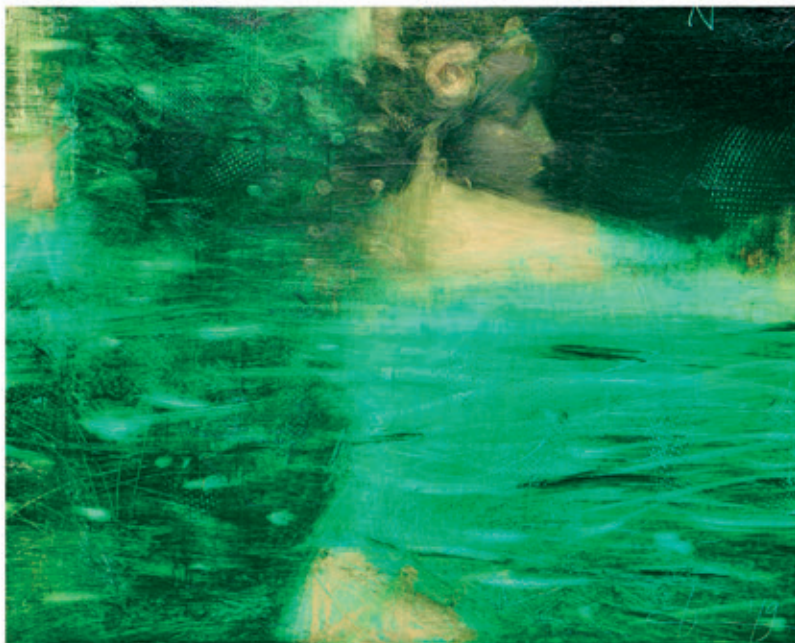
Kancedajlow Wladimir „Nimfa” 50x70 olej na płótnie