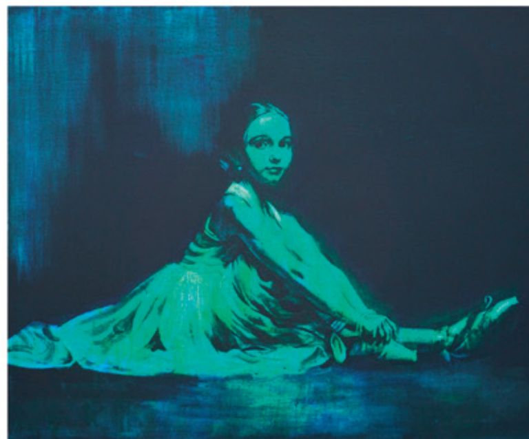
Hriniewicz Siergiej „Baletnica” 100x120 akryl na płótnie