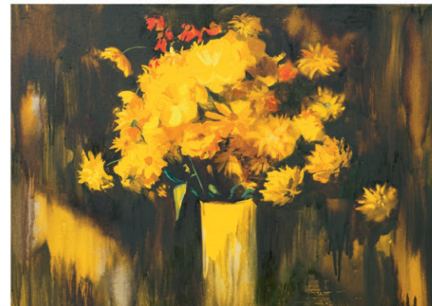
Sumarewa-Kopacz Daria „W blasku słońca” 50x70 olej na płótnie