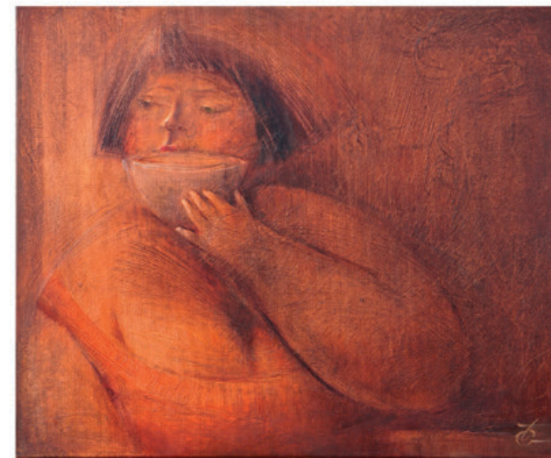
Gardasznikowa Tatiana „Niezależna” 50x60 olej na płótnie