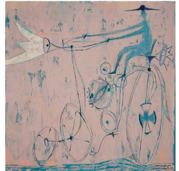
Semiletow Ivan „Łapacz snów” 60x60 olej na płótnie