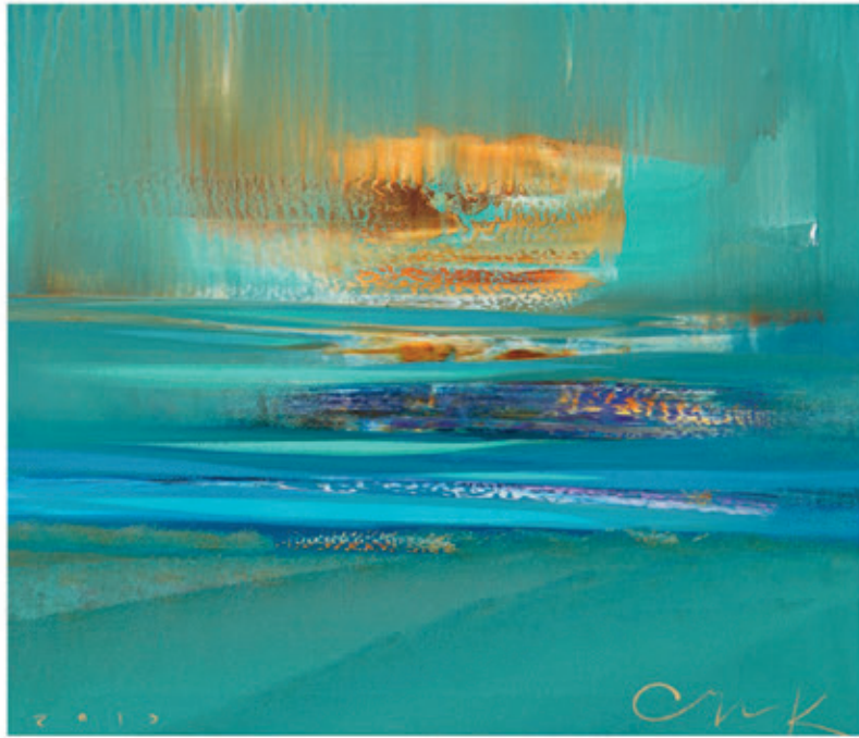
Sumarewa Katerina „Światło” 60x70 olej na płótnie