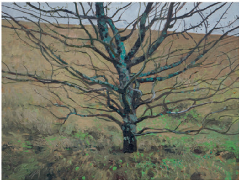
Griszkewicz Aleksander „Ulęgałka” 30x40 olej na płótnie