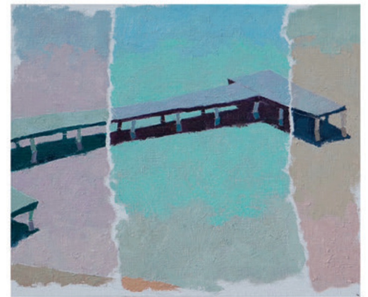
Semiletow Boris „Przemiana” 50x60 olej na płótnie