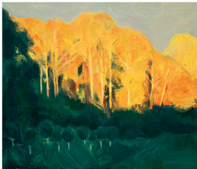
Matuszewicz Wasilij „Ułamek szczęścia” 60x70 olej na płótnie